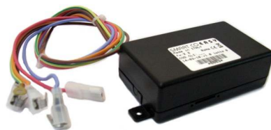
Easy con Cablaggio nel contenitore