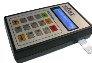
Programmatore SIM Per tutte le Smart Co Portatile a batterie ricaricabili ni-mh